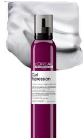
MOUSSE 10 -1 250ml

Hidrata intensamente para un resultado suave y sedoso