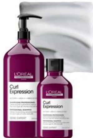
SHAMPOO 300ml & 1500ml