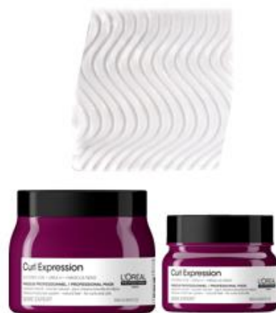
MASCARA 250ml & 500ml