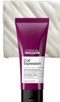
CREMA PARA PEINAR 200ml

Hidrata intensamente para un resultado suave y sedoso